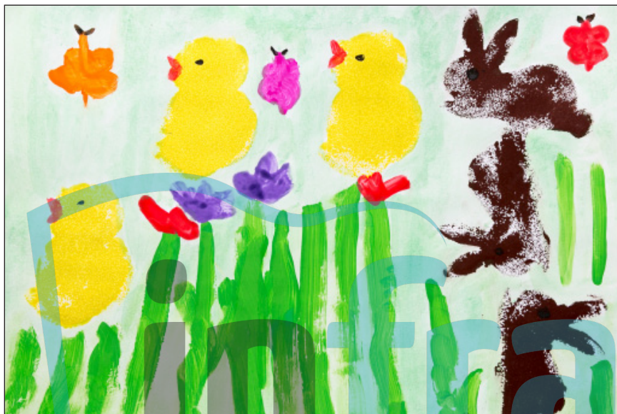
2.4 Krtko Vrta a zvieratká