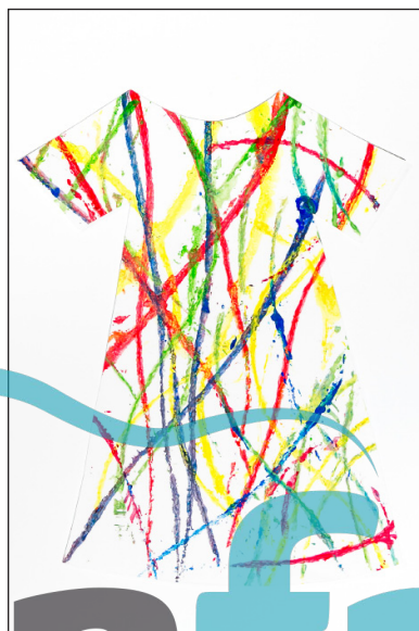
1.9 Šaty pre myšku